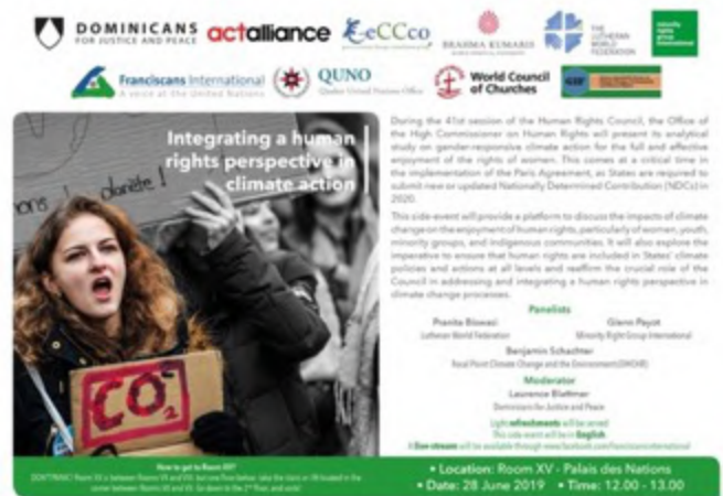
Flyer de l'événement parallèle organisé lors de la 41ème session du CDH

La Délégation a également organisé un événement parallèle à la 41ème session sur "l'intégration d'une perspective des droits humains dans l'action climatique" en étroite collaboration avec les membres du Forum interreligieux de Genève sur le changement climatique, l'environnement et les droits de l'homme - GIF.