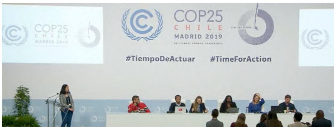
Conférence de presse à la COP25 sur le dialogue interreligieux sur l'espoir et l'action

Du 2 au 13 décembre 2019, Dominicains pour la justice et la paix a participé à la Conférence internationale annuelle sur le changement climatique (COP25) à Madrid. Avec 7 autres membres de 4 organisations dominicaines - Dominican Sisters international (DSI) , Acción Verapaz , Samba Martine-Observatorio de Derechos Humanos et Selvas Amazonicas - la Délégation a apporté une grande diversité d'expériences et de perspectives dans les discussions sur le changement climatique. De nombreuses activités ont été organisées conjointement, notamment :