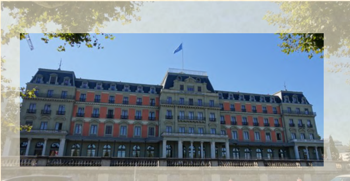
Bureau du Haut-Commissariat des Nations Unies aux Droits de l'Homme (Palais Wilson), Genève

Grâce à ces programmes, la Délégation a soutenu en 2019 plus de 200 membres de la Famille dominicaine et partenaires de la société civile dans la promotion et la protection des droits humains.