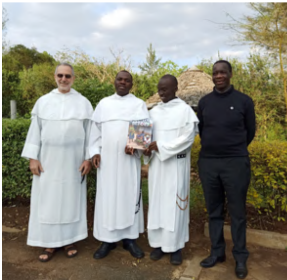
L'équipe de Nairobi

Nairobi est le siège du Programme des Nations Unies pour l'environnement (PNUE) et du Programme pour les établissements humains. (ONU-HABITAT). Le PNUE est la principale organisation mondiale traitant des questions environnementales. Elle joue un rôle important en aidant les nations à respecter leurs engagements en matière d'environnement. Elle s'occupe de toutes les questions environnementales telles que le changement climatique, les écosystèmes et la biodiversité, les produits chimiques et les déchets, l'air, l'eau, les océans, les mers et les forêts. Depuis 2018, Dominicains pour la justice et la paix est observateur à l'Assemblée des Nations Unies pour l'Environnement (UNEA) du PNUE, ce qui permet aux dominicain(e)s d'avoir une présence active dans les différentes sessions de l'UNEA et de ses organes subsidiaires.