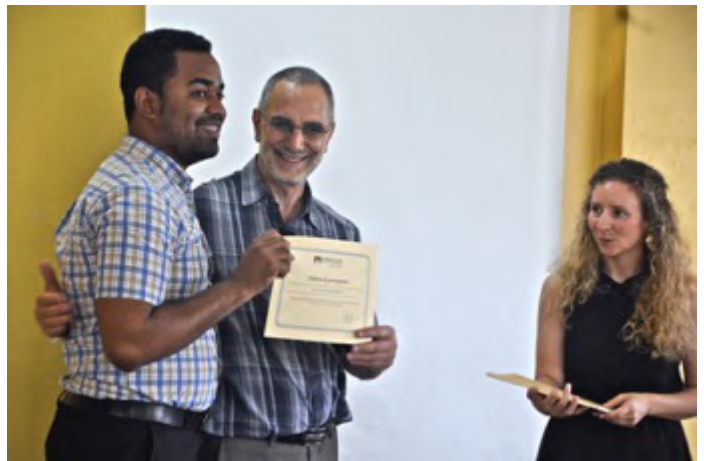
Atelier de suivi sur les droits humains à El Seibo, mai 2019

Outre son soutien à cette lutte courageuse, Dominicains pour la justice et la paix a continué à accompagner les victimes des expulsions forcées perpétrées en 2016 par la compagnie sucrière Central Romana. La Délégation a multiplié ses efforts, notamment par le biais d'une campagne médiatique, pour les accompagner afin que la compagnie réponde de ses actes et que les victimes obtiennent réparation. Les victimes convoquent maintenant Central Romana devant les tribunaux aux États-Unis.