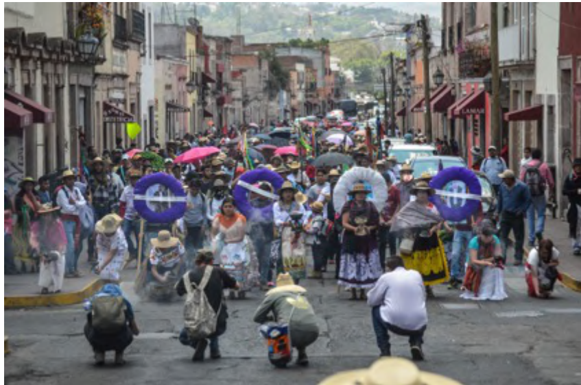
CDHVitoria accompagne les peuples autochtones dans leur lutte pour une meilleure reconnaissance de leurs droits au Mexique

Au Mexique, l'année 2019 a été marquée par la mise en place du gouvernement nouvellement élu d'Andrés Manuel Lopez Obrador. Malgré les promesses du nouveau gouvernement d'améliorer le bilan du pays en matière de droits humains, la mise en œuvre effective de ses obligations dans ce domaine a fait défaut. L'extrême violence répandue par les groupes du crime organisé, les exécutions extrajudiciaires et la torture perpétrées par les forces de sécurité, le dénigrement des organisations de la société civile, les attaques contre les journalistes, le manque de protection adéquate pour les femmes et les filles, les violations des droits des migrants et des demandeurs d'asile et l'ignorance du travail des défenseurs des droits humains ont continué à être des sujets de préoccupation dans le pays en 2019. Dans ce contexte, Dominicains pour la justice et la paix a soutenu le Centro Fray Francisco de Vitoria OP (CDHVitoria) dans son travail de surveillance des droits humains et de contrôle de la mise en œuvre des promesses faites par le gouvernement.