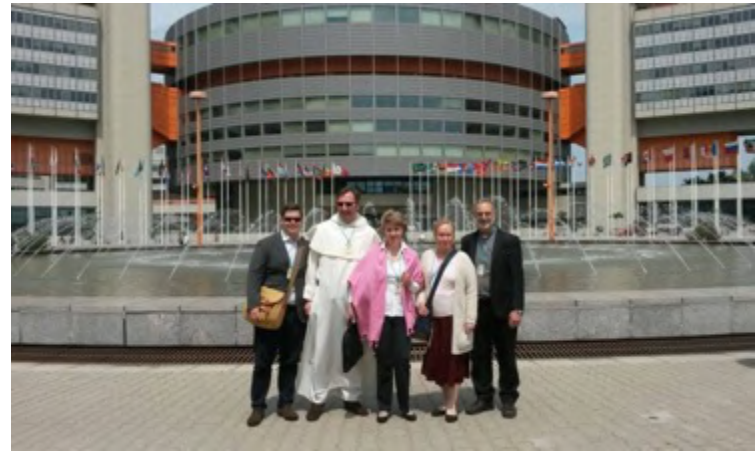
L'équipe de Vienne devant les Nations Unies à Vienne

Vienne est le siège d'un certain nombre de bureaux des Nations Unies qui traitent de sujets cruciaux tels que la criminalité transnationale organisée, la justice pénale, les stupéfiants, la corruption et l'énergie nucléaire. L'équipe de Vienne collabore principalement avec l'Office des Nations Unies contre la drogue et le crime (ONUDD) et plus particulièrement avec la Commission pour la prévention du crime et la justice pénale (CCPCJ). Les thématiques qui ont été reconnues prioritaires par la Délégation sont liées aux problèmes auxquels la Famille dominicaine est confrontée sur le terrain ; il s'agit de la traite des êtres humains, la réforme des prisons, la criminalité forestière et l'éducation à la justice.