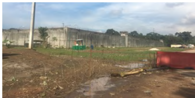
Maison d'Arrêt et de Correction d'Abidjan (MACA)

Depuis la création de la Commission dominicaine Justice et Paix en Côte d'Ivoire en 2017, l'engagement de la Famille dominicaine sur les questions de justice et de paix a considérablement augmenté. Dans un pays où les garanties des droits humains, la sécurité et la stabilité sont encore fragiles, le travail de cette Commission, et la nécessité de la renforcer, sont essentiels. Ainsi, Dominicains pour la justice et la paix a maintenu la Côte d'Ivoire parmi ses pays prioritaires en 2019 et a soutenu les efforts entrepris sur le terrain.