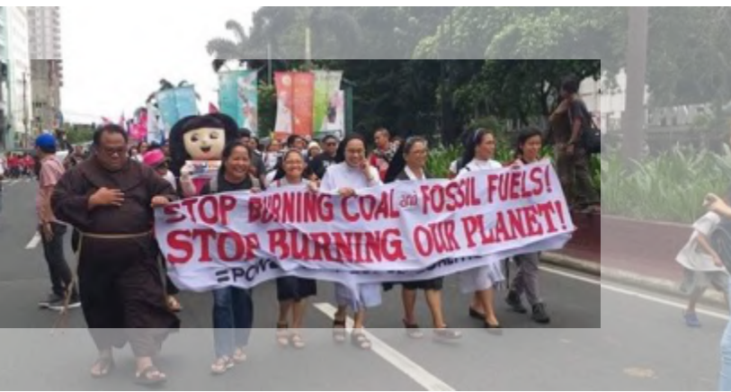
Dominicain(e)s et franciscain(e)s en marche lors de la grève mondiale pour le climat afin de mettre fin à l'utilisation des combustibles fossiles aux Philippines

Depuis la prétendue "guerre contre la drogue" du Président Duterte, le bilan en matière de droits humains aux Philippines s'est considérablement dégradé. En 2019, les voix dissidentes des membres de l'opposition, des défenseurs des droits humains, des chefs religieux et des journalistes ont été violemment réprimées. Les meurtres, disparitions forcées, arrestations et détentions arbitraires ont continué à avoir lieu, créant un climat de terreur au sein de la population. Cette situation alarmante a été portée à l'attention du Conseil des Droits de l'Homme en juin 2019. La société civile, les chefs religieux et les délégués des États ont appelé à l'adoption d'une résolution sur la situation dans le pays. La Délégation a soutenu cet appel et co-parrainé un événement parallèle au cours duquel des activistes locaux ont fait le point sur la situation des droits humains dans le pays. Le Conseil a finalement adopté cette résolution dans laquelle les États demandent instamment au Gouvernement des Philippines de prendre toutes les mesures nécessaires pour notamment prévenir les exécutions extrajudiciaires et les disparitions forcées.